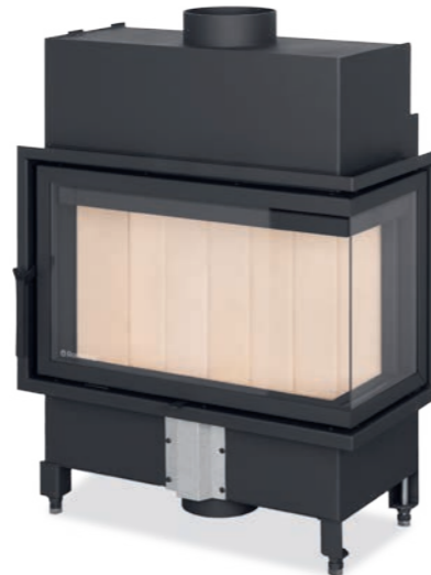
Referencia: BASIC E2 67/31-D rincón dcha. BASIC E2 67/31-I rincón izq.

P R 3,5-9,1 kW % 86,6 % Ø 180 mm ▣ 407 x 677 x 307 mm A*