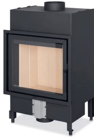
Referencia: BASIC F 54/47

P R 3,3-8,4 kW % 85,3 % Ø 180 mm ▣ 467 x 554 mm A*