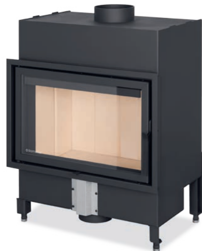
Referencia: BASIC F 65/41

P R 2,7-8,3 kW % 85,1 % Ø 180 mm ▣ 407 x 667 mm A*