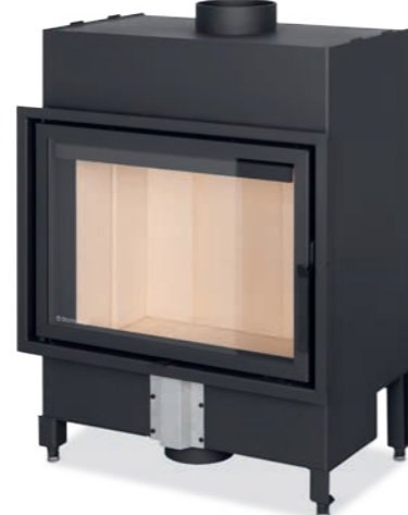
Referencia: BASIC F 65/47

P R 4,5-11,7 kW % 80,3 % Ø 180 mm ▣ 467 x 664 mm A*